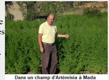
Dans un champ d'Artémisia à Mada